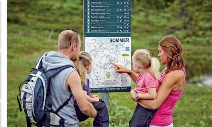
Det er enkelt å finne fram på Golsfjellet. Skilt og «oversiktskart» i nummererte kryss og på topper.