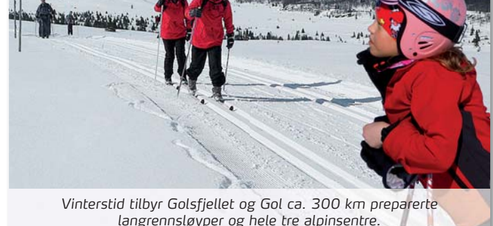
Vinterstid tilbyr Golsfjellet og Gol ca. 300 km preparerte langrennsløyper og hele tre alpinsentre.

Find an overview of events and activities in Gol, Golsfjellet and Hallingdal on www.golinfo.no Subject to errors or changes in this brochure! Please inform us about errors and omission to post@golsfjellet.com