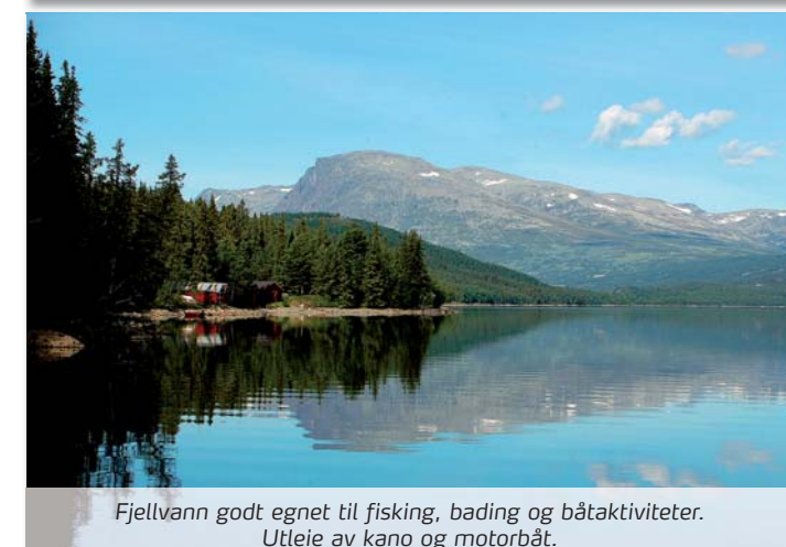
Fjellvann godt egnet til fiske, bading og båtkaktiviteter. Utleie av kano og motorbåt.

Golsfjellet – det familievennlige fjellet! Med aktiviteter og opplevelser for liten og stor, ligger alt til rette for at hele familien skal trives på Golsfjellet! I et familievennlig fjellterreng, med utsikt til blant annet Jotunheimen, Hemsedalsfjella og Hallingskarvet, kan du oppleve: • Et av landets beste område for fjellsykling • Godt merka turstier • Topp 11 – vandrepogram for hele familien • Flotte fiskevann og elver • Båt- og sykkelutleie • Ridesenter • Barnas Bondegård • Gildehallen • Badeplasser • Svømmebasseng og «MiniBadeland» • Serverings- og overnattingssteder.